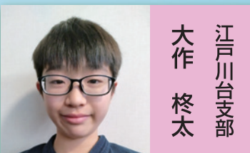
江戸川台支部 大 柁太

僕は、小学四年生の十月から剣道を始めました。始めるのが遅めで、自分よりも年下の子たちにも置いていかれている感覚がありました。試合でもなかなか一本がとれず、自分に対して不安がありました。でも、先生たちの力強く分りやすい指導で、試合で一本をとることができるようになりました。少しづつ勝てるようになり、中学生になっても、先生方に様々なことを教えてもらって、強くなっていきたいです。